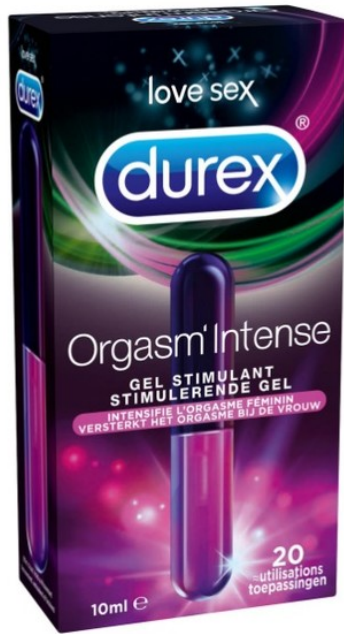
Orgasm'Intense Gel (€ 10,99) Durex